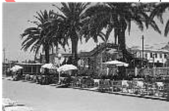
ao fundo a cabine de som (anos 60)

Uma interessante experiência que jamais esqueci e a que se juntavam artigos para a juventude que tinham sido escritos na revista jovem em Lisboa, a “Musidisco” e mais tarde na “Flama”. Esta faceta literária da juventude vinha na sequência da publicação entre 1963 e 1964 do jornal “Centauro” dos alunos do Liceu Alexandre Herculano, em oposição ao velho jornal “oficial Prelúdio” que considerávamos conservador, estático e formal. Escrevia-se sobre tudo e todos desde xadrez a poesia. Outra memória radialista, é a dos anos em que fiz rádio em Macau (1977-1982) na Emissora de Radiofusão de Macau (ERM, depois Rádio Macau da RTP) e que jamais esquecerei.