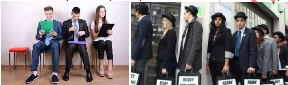
E termino com notícias do ensino sobre o qual nem quero falar. No relatório PISA deste ano pode ler-se que

Tinha prometido não voltar a falar da SATA e do seu gestor em tempo parcial, pois quando for privatizada todos terão saudade do que ela é hoje, apesar de estar péssima...mas tem tantos problemas endógenos que os exógenos parecem fáceis de resolver, embora seja mais fácil deixá-la absorver pela IcelandAir ou TAP... à semelhança de Cabo Verde (alguém me disse que na nova administração está o responsável por ter resolvido assim o problema da transportadora nacional de Cabo Verde).