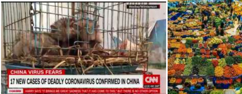
Se os mercados chineses fossem assim não haveria vírus

Uma das explicações mais lógicas para estes surtos encontram-se nos mercados de animais vivos que se encontram por toda a Ásia, e muito especialmente na China. De acordo com o projeto Global Virome, que visa melhorar a maneira de lidar com as pandemias, existem mais de 1,7 milhão de vírus não descobertos na vida selvagem e quase metade deles pode ser prejudicial aos seres humanos.