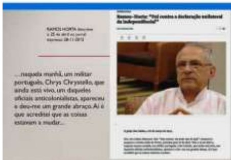
O golpe das Caldas, a 16 de março de 1974.

Como antimilitarista, ferrenho e empedernido, que sempre fui e recordando que fui obrigado a ir para fora defender um Império que já não existia e que, a mim, nada dizia, tenho de admitir que de nada me envergonho nesses anos, em que agi de acordo com a minha consciência, com a minha ação anticolonial como melhor forma de servir a dita "pátria" (segundo Ramos Horta eu era um oficial anticolonialista (in Expresso em 28/11/2015