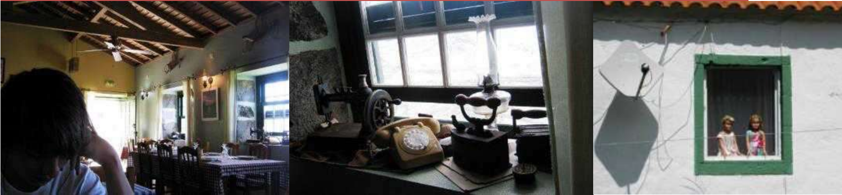
RESTAURANTE POR DO SOL NA FAJÃZINHA - FAJÃZINHA (SÓ TINHA VISTO ALGO SIMILAR EM PALHOÇA, FLORIANÓPOLIS, ESTADO DE SANTA CATARINA) -

Descemos à Ponta Ruiva, numa estrada nova, curiosamente marcada a tinta branca no pavimento, com dizeres alusivos aos abusos do Presidente da Junta. Esta manifestação pictográfica prolongava-se por centenas de metros listando todos esses alegados abusos. Uma forma deveras original de fazer campanha eleitoral.