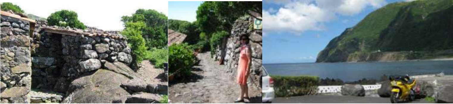
ALDEIA DA CUADA (HTTP://WWW.WONDERFULLAND.COM/WONDER2006/SLEEP/CUADA/INDEXHOUSE.HTM) FAJÃ GRANDE