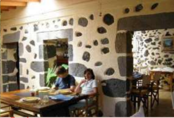
CASA DO REI, RESTAURANTE NAS LAJES