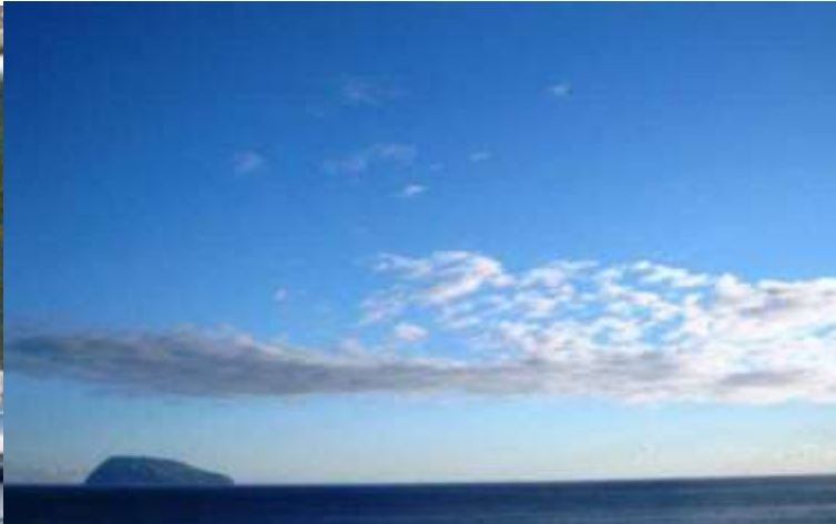
PARTIDA DO CAIS DO PORTO DA CASA NO CORVO