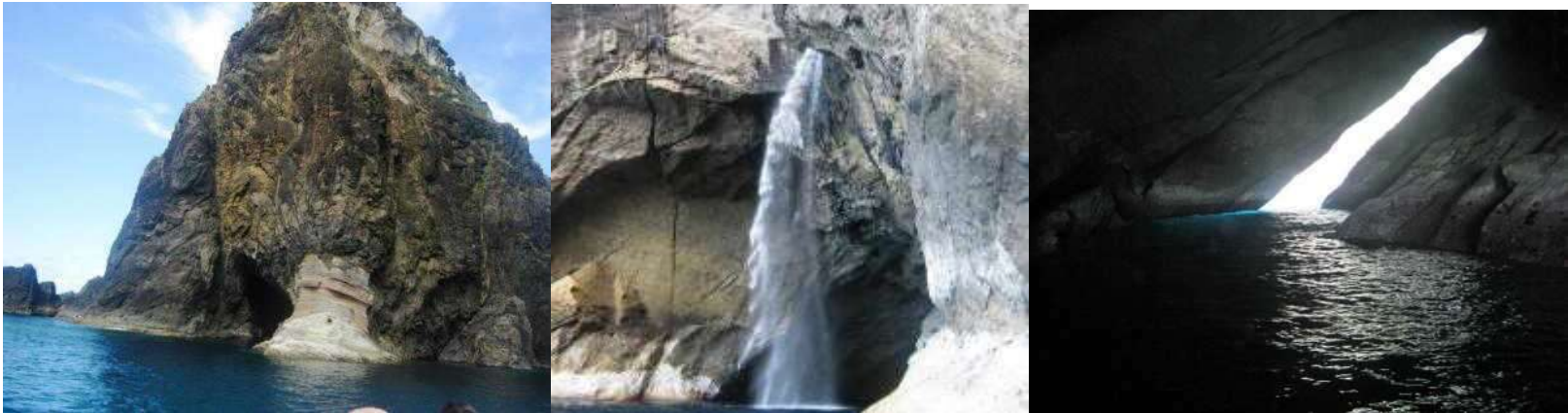
GRUTAS E ROCHAS NA COSTA DAS FLORES