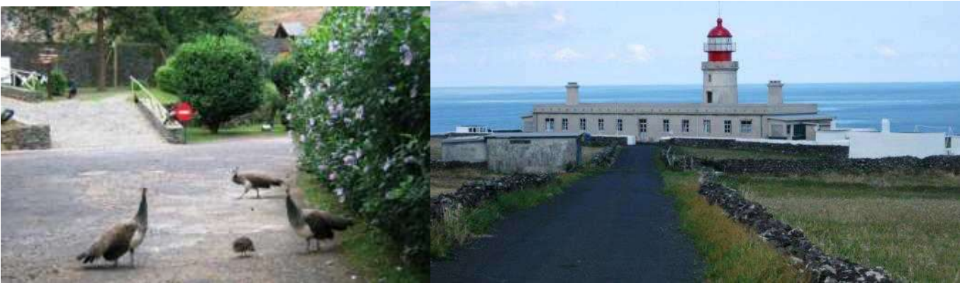
PARQUE FLORESTAL DE RECREIO PAULO CAMACHO, ANTIGA RESERVA FLORESTAL DE RECREIO DA FAZENDA DE SANTA CRUZ - FAROL (DA PONTA) DE ALBERNAZ

Saindo de Santa Cruz fomos ao Monte e visitamos o parque florestal de recreio Paulo Camacho, antiga Reserva Florestal de Recreio da Fazenda de Santa Cruz. Ali vimos gamos, faisões de oito subespécies diferentes, galinholas, codornizes, pavões, melros, patos, gansos, coelhos e várias árvores nativas e algumas invasoras, devidamente assinaladas. Havia também um viveiro de truta arco-íris. Um local extremamente bem tratado, com amplas facilidades para piquenique e para crianças, apenas a uns minutos de Santa Cruz.