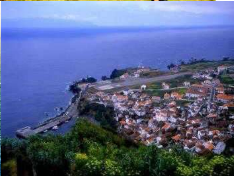
AERODROMO DO CORVO

A viagem correu bem sem sobressaltos, mas se vislumbrarem os prometidos golfinhos nem baleias (cachalotes).