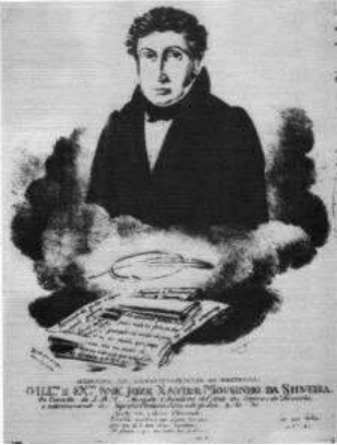
MOUZINHO DA SILVEIRA

A impressão foi tal que Mouzinho da Silveira, hoje homenageado como patrono da Escola Básica Integrada do Corvo, anos depois escreveria no seu testamento que gostaria de estar sepultado na ilha, "cercado de gente que na minha vida se atreveu a ser agradecida".