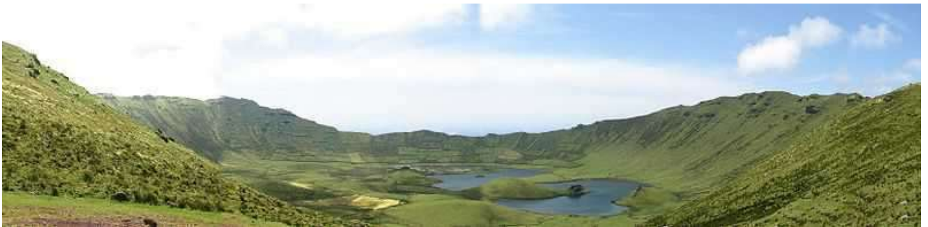
CALDEIRÃO DO CORVO

O guia navegador, há 20 anos metido nisto, apoia a Universidade dos Açores e seus biólogos, e deu explicações detalhadas sobre cagarros, a pesca do atum e aspetos da vida marinha.