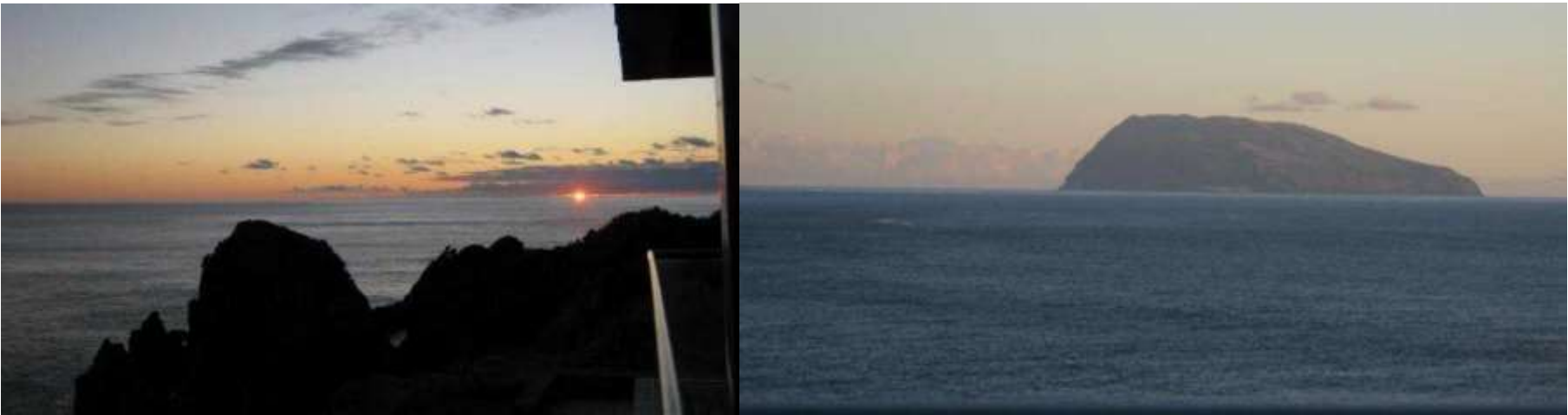
NAScer DO SOL NO INATEL DAS FLORES CORVO AO NAScer DO SOL

Podia ficar aqui neste belo ponto do mapa a desfrutar desta paisagem e aguardar a chegada do inverno com as suas ondas de 8 a 10 metros que devem banhar a piscina e o jardim aqui por baixo da varanda da suíte.