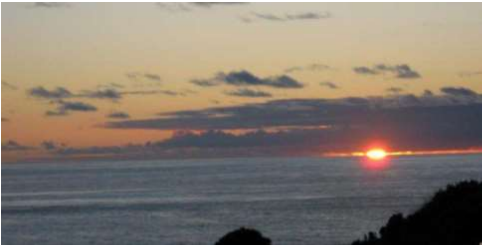
MAJESTOSO NASCER DO SOL EM SANTA CRUZ DAS FLORES

Situa-se a 30° 54' de longitude oeste, e a 39° 25' de latitude norte. Tem 143 km 2 de superfície, 17 km de comprimento e 12,5 km de largura. A superfície da ilha é repartida por dois municípios - de Santa Cruz das Flores e de Lajes das Flores. A ilha, junto com a Ilha do Corvo, foram o Grupo Ocidental do arquipélago das Açores. A 26 de maio de 2009, foi classificada pela UNESCO como Reserva da Biosfera. Os principais centros populacionais são as vilas de Santa Cruz das Flores e das Lajes das Flores. Dispõe de um aeródromo ou pequeno aeroporto onde opera a SATA Açores, com ligações aéreas regular com a Horta, Lajes (Terceira), Ponta Delgada e Corvo. Entre julho a agosto, a Atlanticoline assegura (de forma bem mais irregular do que o previsto nos horários oficiais) as ligações marítimas de passageiros e viaturas entre o porto da vila das Lajes das Flores (via Horta) com as restantes ilhas. Assegura ainda o transporte regular de passageiros entre as vilas das Lajes e Santa Cruz das Flores e a Vila do Corvo.