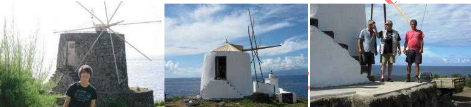
MOINHOS DO CORVO, UM EX-LÍBRIS