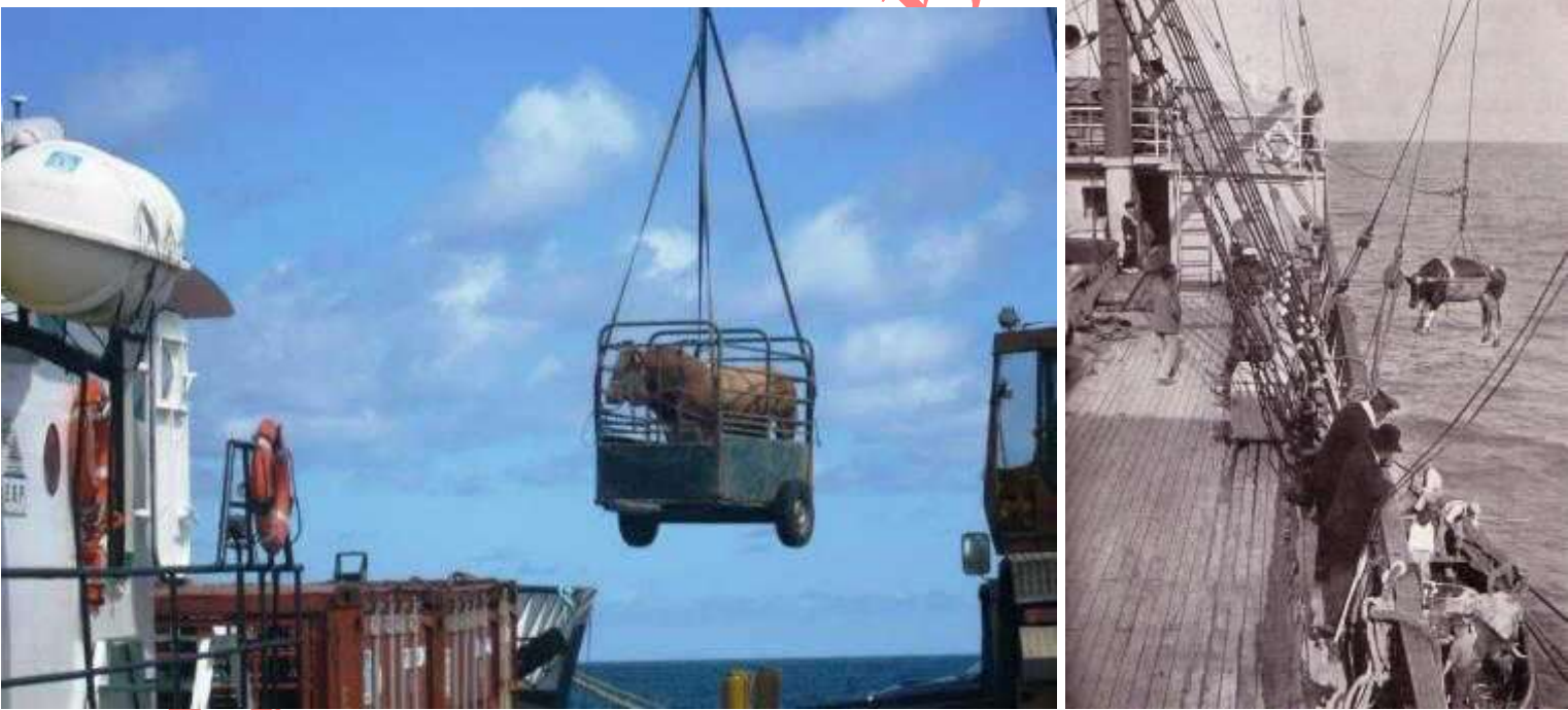
PORTO DA CASA TRANSPORTE DE GATO ATUALMENTE E DANTES