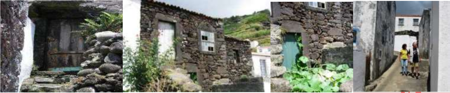
DEGRADAÇÃO DO PARQUE HABITACIONAL DO CORVO