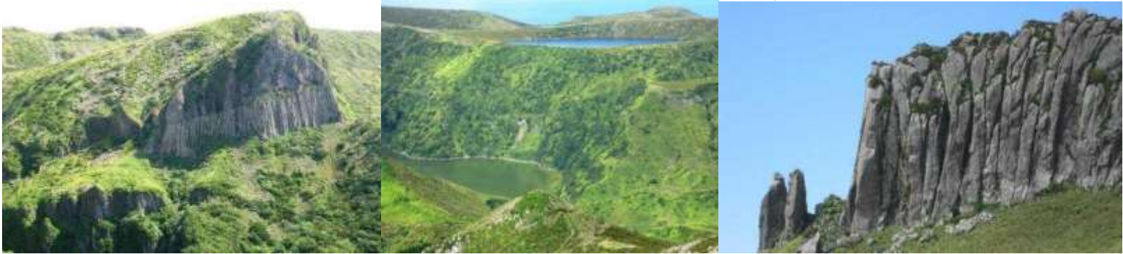
ROCHA DOS BORDÕES CALDEIRAS FUNDA E COMPRIDA NÃO SÃO OS BORDÕES, MAS SÃO BONITOS (MORRO DOS FRADES)

Dali partimos para a Fajã Grande que impressionou por ser bem maior, bem pintada e tratada, muitas casas em bom estado de conservação, mansões modernas e uma avenida à beira-mar, rodeando uma enorme extensão de lava negra como a do Pico (junto ao Cachorro e Lagido), cobertas de pequenos pontos verdes de plantas que teimaram em crescer no seio da própria rocha. Também de rocha era a praia sem areia.