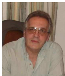
por Chrys Chrystello

Presidente da Comissão Executiva dos Colóquios da Lusofonia